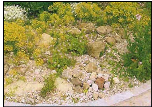
Beispiel für eine Kies- bzw. Schotterflur (Trockenbiotop)