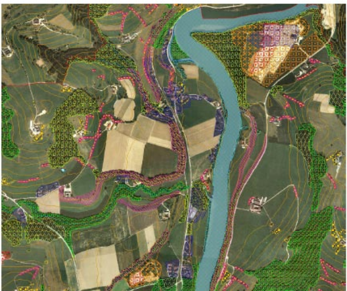
Auszug aus der graphischen Darstellung der Erhebungstypen